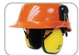
EP167 防護耳罩 (NRR 30db)