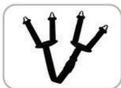
DELTA PLUS DYNAMIC JUGALPHA Y型下巴帶