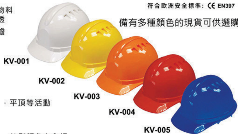
KVS系列-透氣短舌安全帽