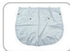
SMAAT UV-NECK Protector 防紫外光頸巾(一片裝)