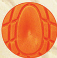
獨特的氣流循環， 可保持腳部透氣及乾爽