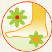
擁有優越的吸汗和透氣性能， 能使腳部保持清爽