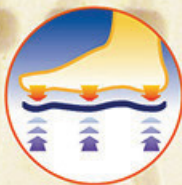
對足跟的按摩作用， 有助緩解足部的疲勞