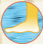
人體工學設計，能完全承托 腳掌和腳跟，使穿著時更舒適